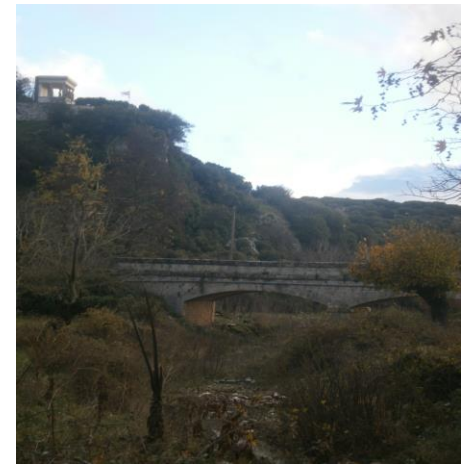
Το Πετρόκτιστο Γεφύρι με το Μνημείο των Καρυάτιδων

Ενημερωτικό Δελτίο του Συνδέσμου των Απανταχού Καρυατών