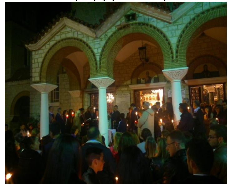
Η Αναστάσιμη Θεία Λειτουργία