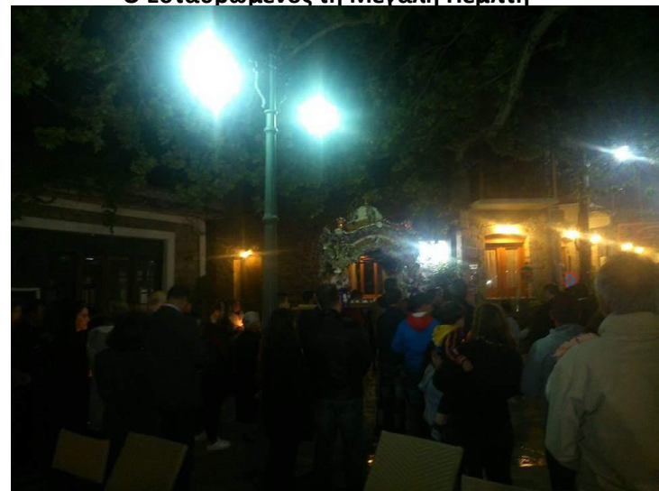
Από την περιφορά του επιταφίου