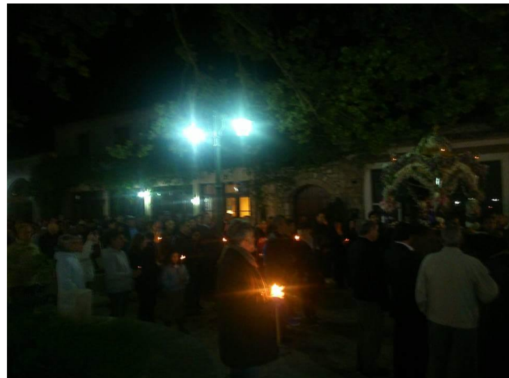
Από την περιφορά του Επιταφίου