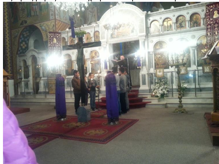
Ο Εσταυρωμένος τη Μεγάλη Πέμπτη

Χριστούγεννα στην πόλη και Πάσχα στο χωριό λέει ο λαός μας και με βάση αυτό το γνωμικό πολλοί συμπατριώτες μας αλλά και επισκέπτες πλημμύρισαν το χωριό μας τις άγιες μέρες του Πάσχα για να εορτάσουν παραδοσιακά την μεγαλύτερη εορτή της Ορθόδοξης Χριστιανοσύνης.