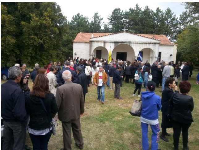
Το εκκλησίασμα έξω από τον Ι.Ν. του Αγίου Γεωργίου