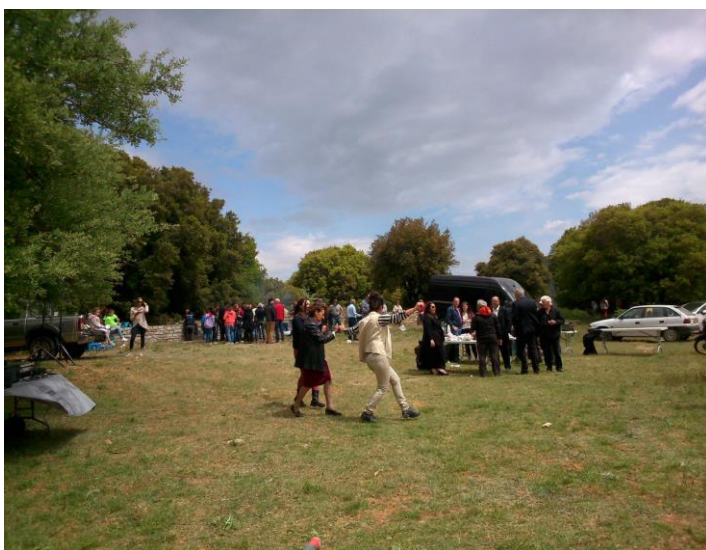
Το πανηγύρι μετά την Θεία Λειτουργία